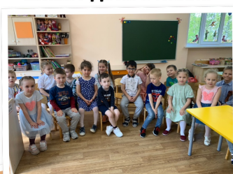
Конкурс чтецов «Читают дети о войне»

Чем ниже уровень развития речи, тем проще и доступнее должны быть художественные произведения.